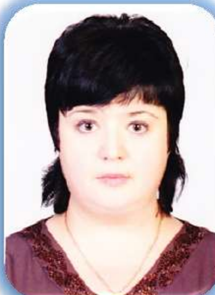
Специалист профкома по работе с ППС