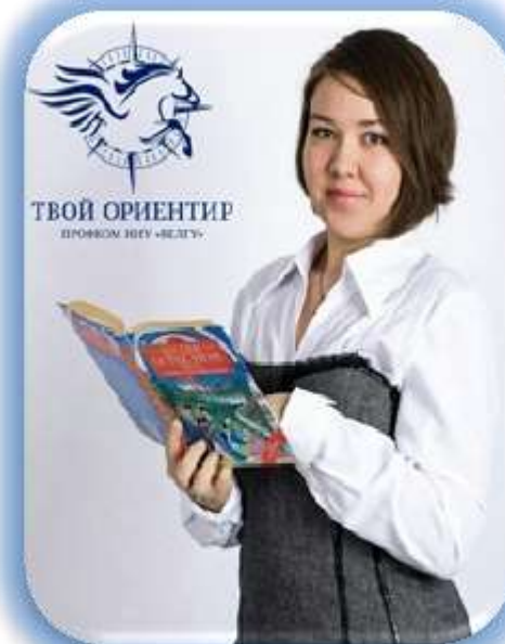
Специалист профкома по работе со студентами